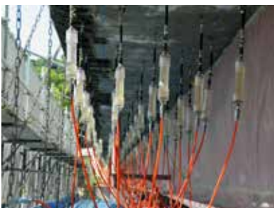
リハビリカプセル設置状況