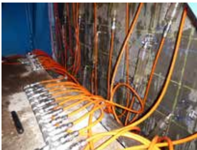
リハビリカプセル工法施工状況