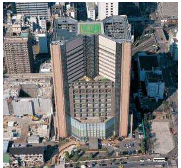
国立がんセンター中央病院