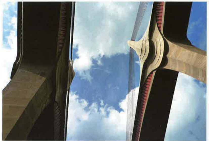
バイフェロックス 配合色