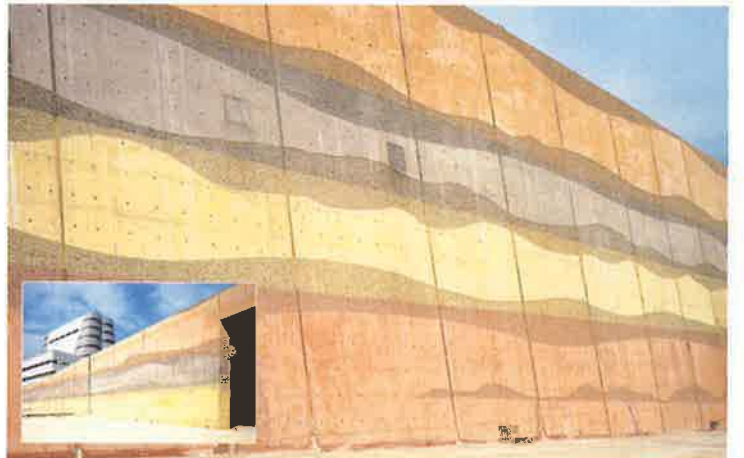
バイフェロックス 赤・黄 配合色