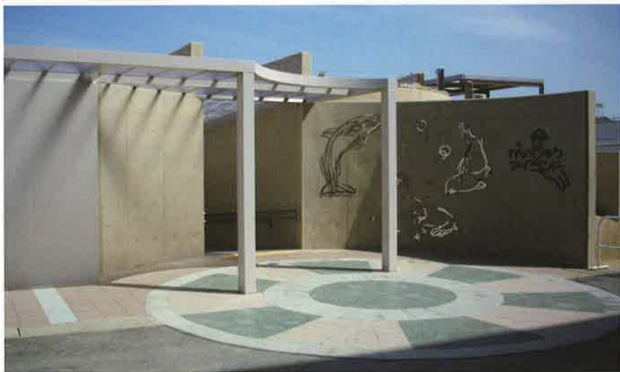
バイフェロックス 配合色