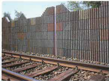
バイフェロックス 各色