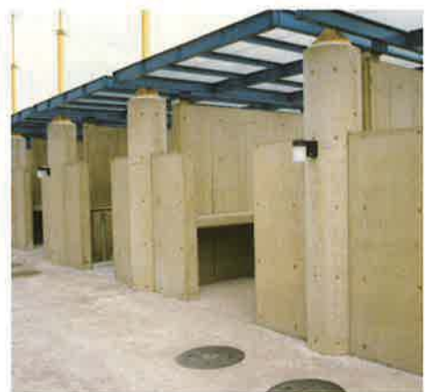
バイフェロックス 黄 920