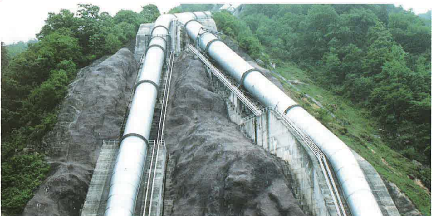
バイフェロックス 茶 686