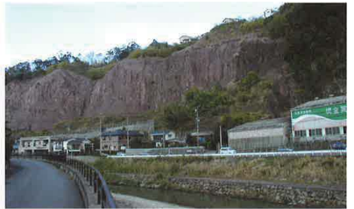
バイフェロックス 茶 663