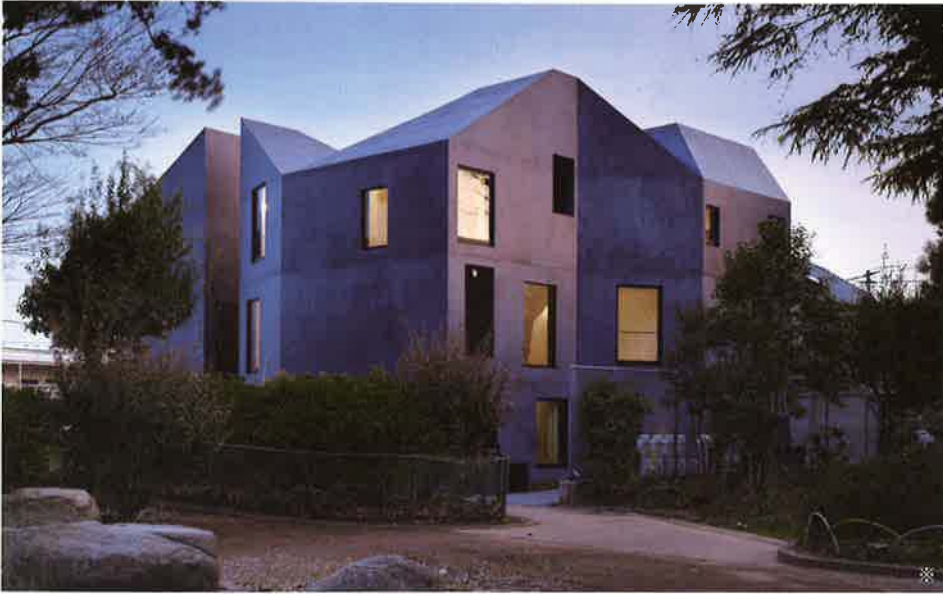
バイフェロックス 4330/3