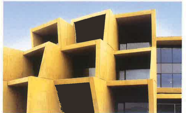
バイフェロックス 黄