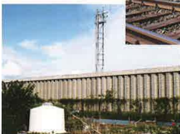
バイフェロックス 配合色