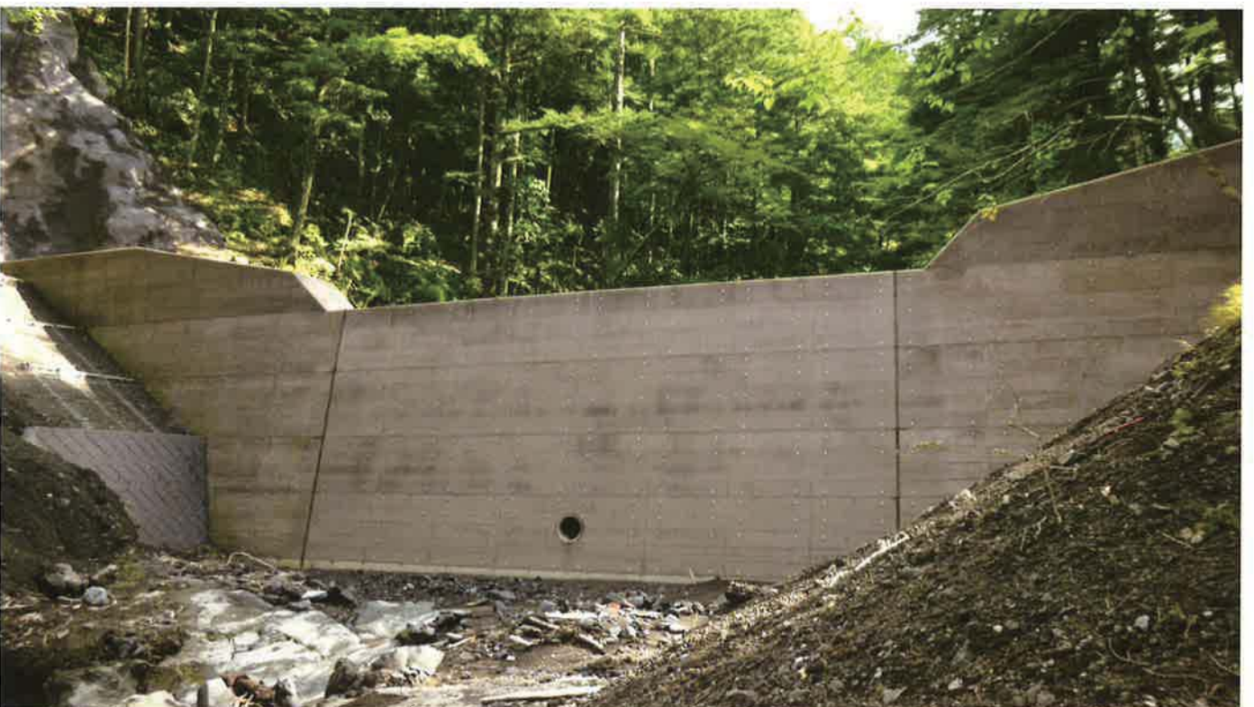
バイフェロックス 配合色