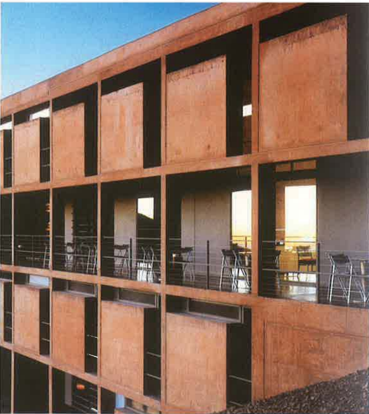
バイフェロックス 茶