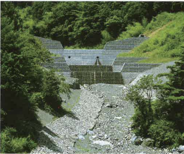
バイフェロックス 黒 318