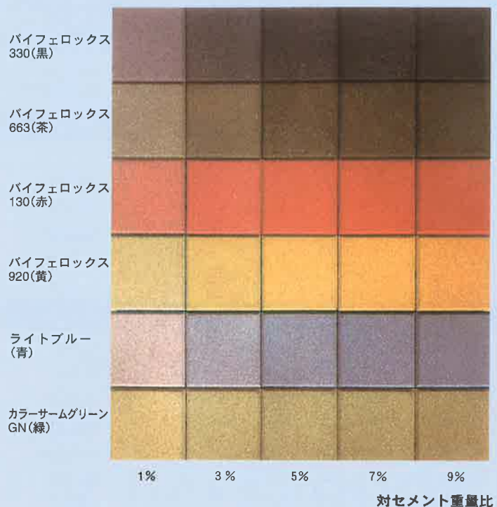
■顔料添加量と着色力(濃度)の関係

ランクセス・無機顔料には黒、茶、赤、黄系のバイフェロックスをはじめ青、緑、白系などの豊富なカラーがあります。右の写真は、普通ポルトランドセメントを用い、各色の顔料を1～9%まで添加量（対セメント重量）を変えて着色したブロックを並べて、色の濃淡の違いを示した例です。