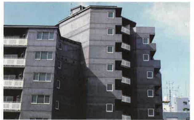
バイフェロックス 黒 330