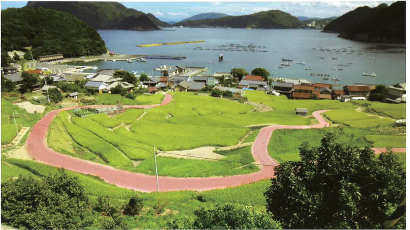
バイフェロックス 赤 110G