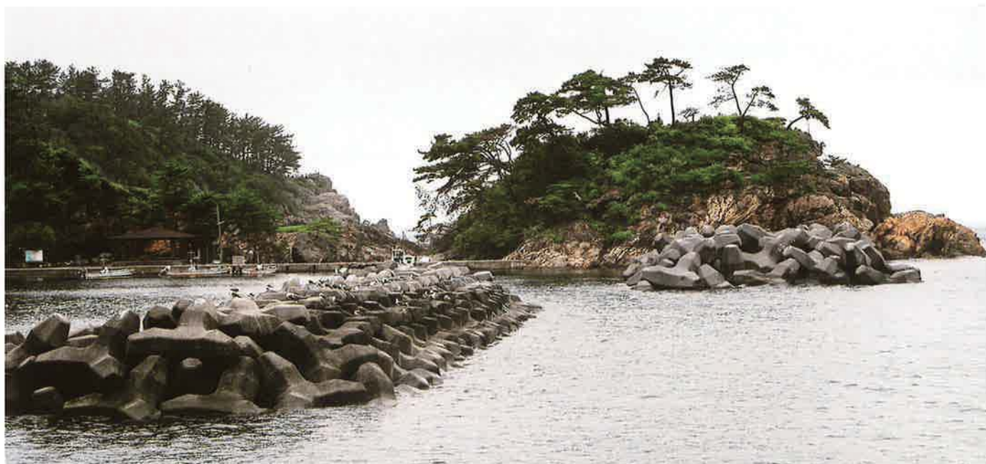
バイフェロックス 黒 330