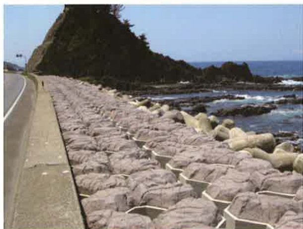
バイフェロックス 配合色