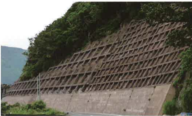
バイフェロックス 茶 663