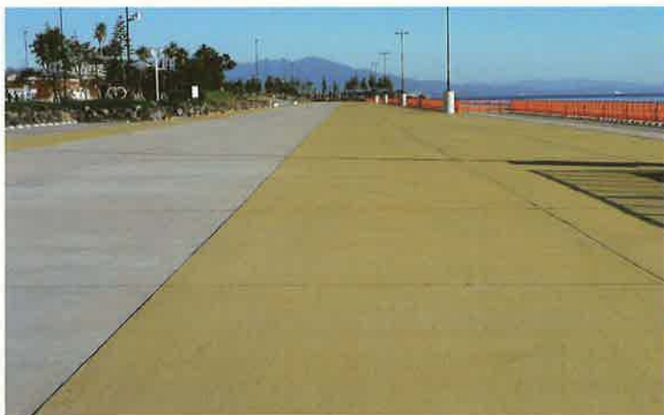
バイフェロックス 黄 920