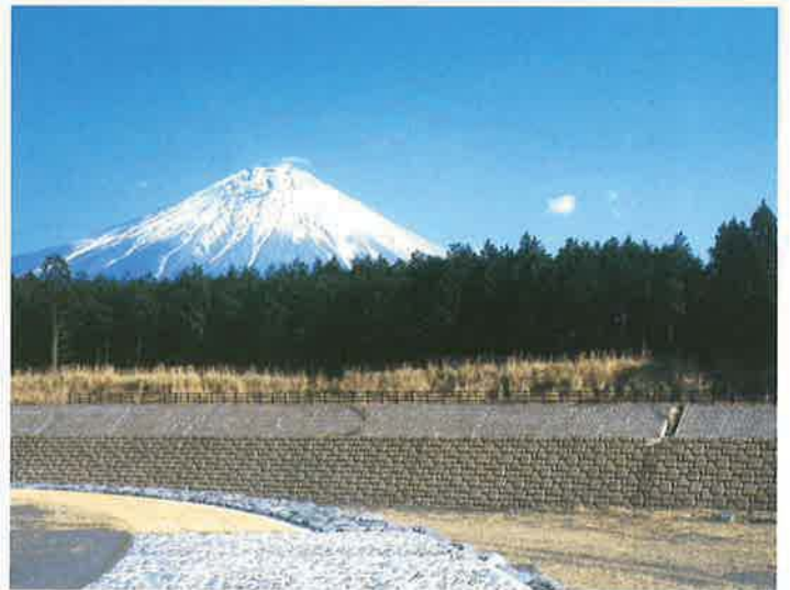
バイフェロックス 茶 686