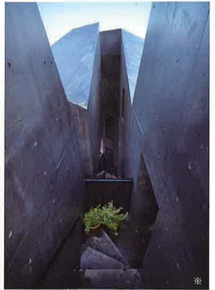
バイフェロックス 4330/3